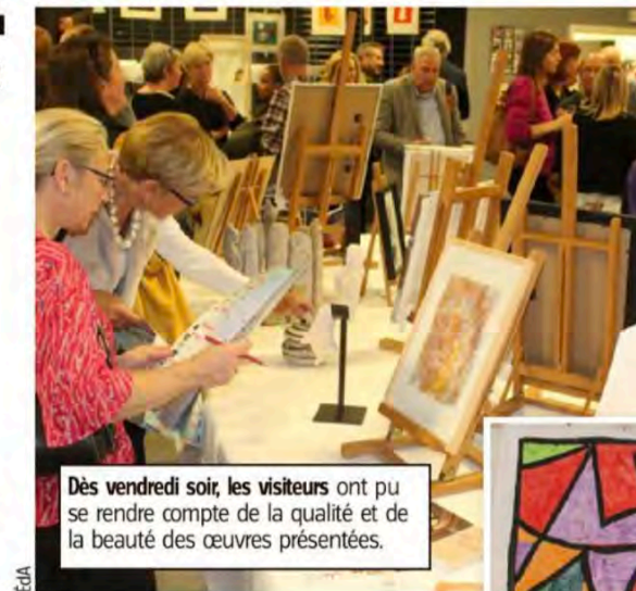
Dès vendredi soir, les visiteurs ont pu se rendre compte de la qualité et de la beauté des œuvres présentées.