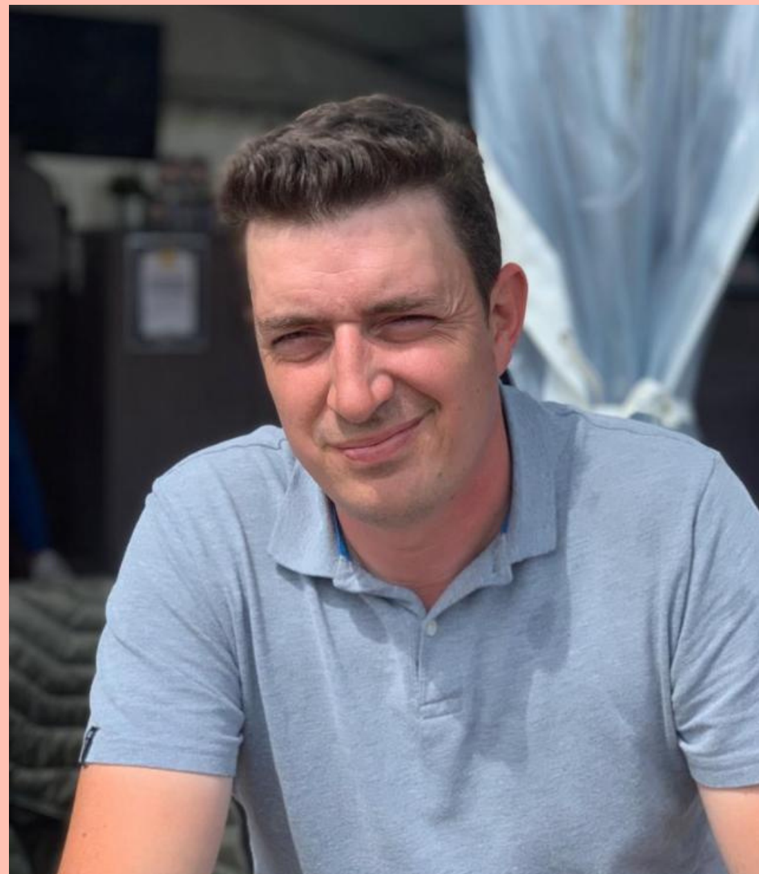
Papa de Sophia et Léa - Ecole d'Opprebais