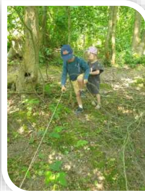
➔ Marche pieds nus