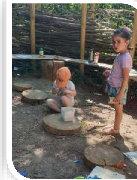
➔ Journée « Ose le vert » : parcours découverte nature